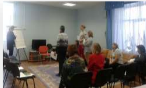
Тренинги для родителей