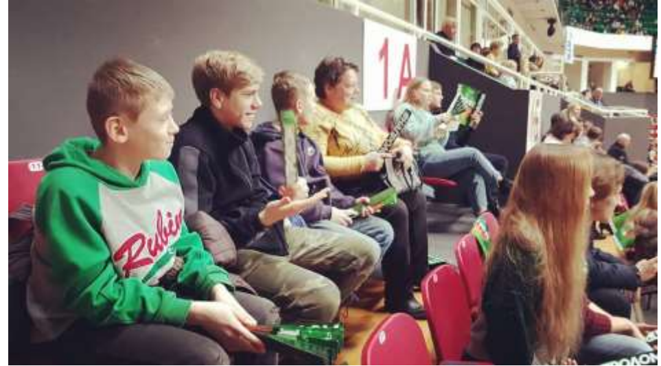
Посещение «Баскет – холла»