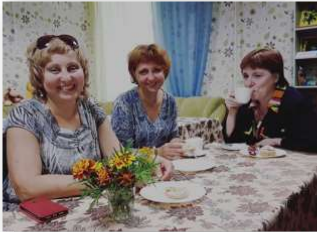
За чашкой чая обсуждать проблемы гораздо легче