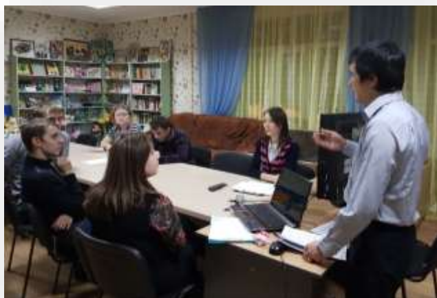
Занятие «Семейный бюджет»