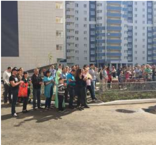
Заселение выпускников интернатных учреждений (ул. Юсупова)