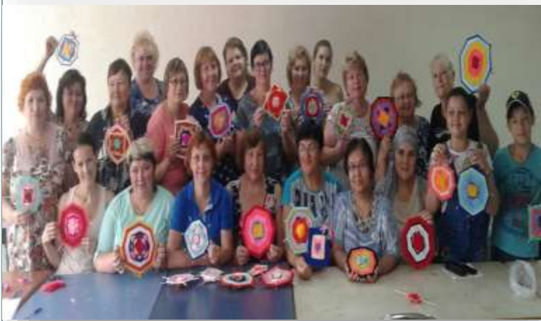
Арт-терапевтическое занятие для родителей