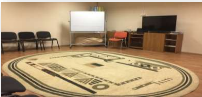
Кабинет для тренингов ШПР