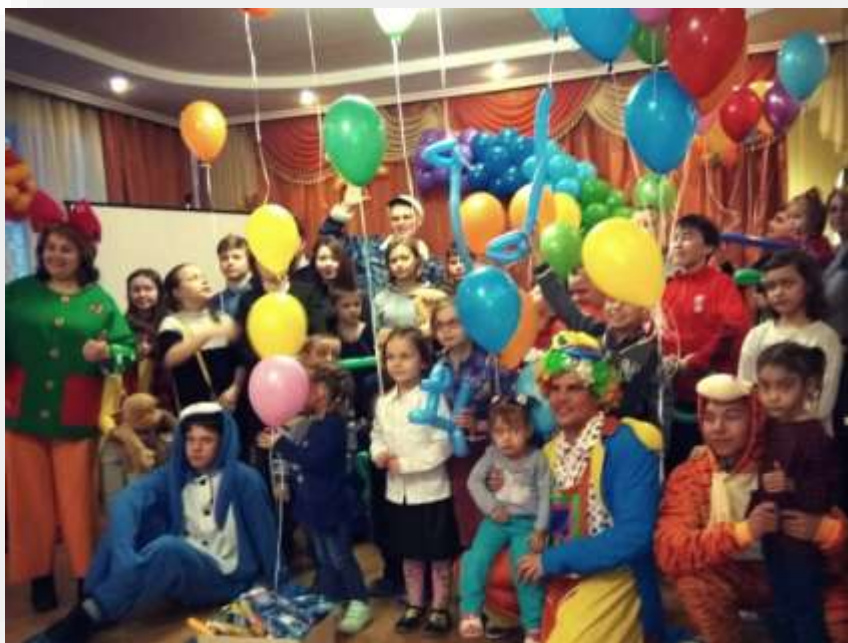
Празднование Дня защитника Отечества

Количество детей, посетивших мероприятия – более 1599