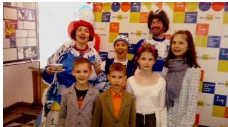
Посещение спектакля «Молодильные яблочки»