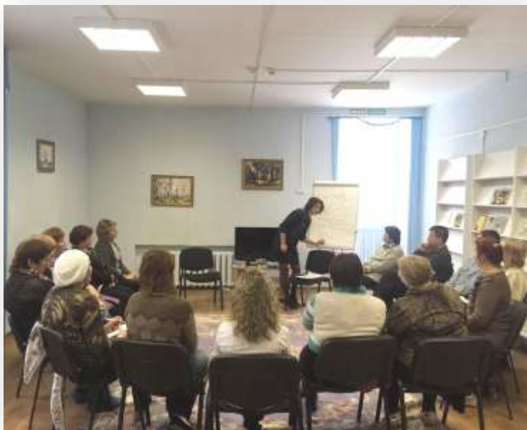
Занятие в ШПР