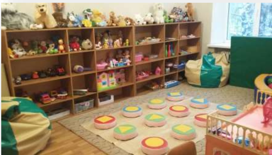
Кабинет недирективной игровой терапии