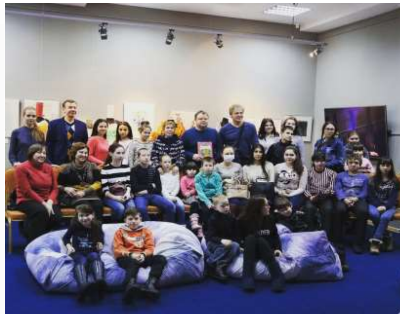
Встреча с командой КВН «Уездный город»