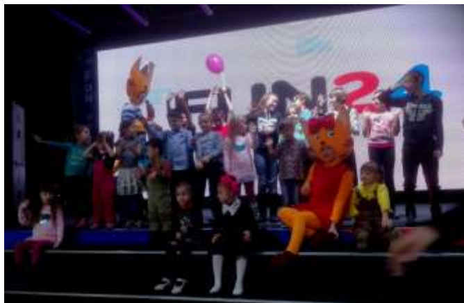
Посещение «FAN 24»