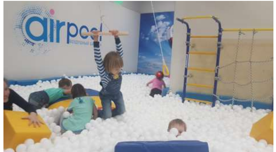
Посещение «Воздушного бассейна»